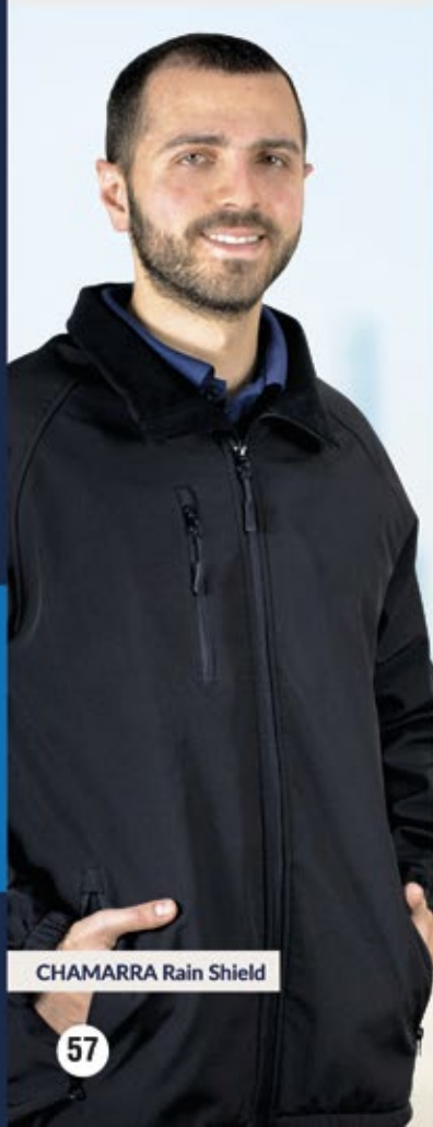
CHAMARRA Rain Shield