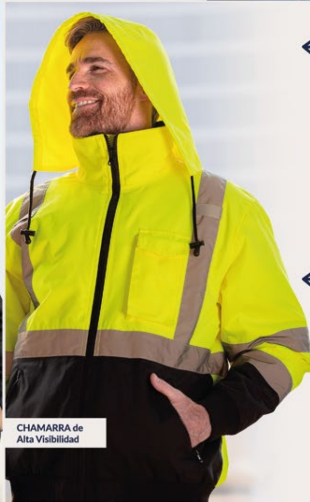
CHAMARRA de Alta Visibilidad