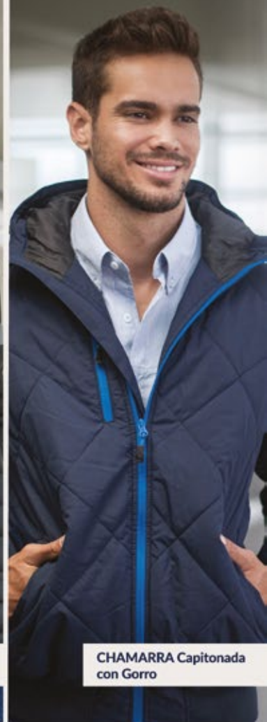
CHAMARRA Capitonada con Gorro