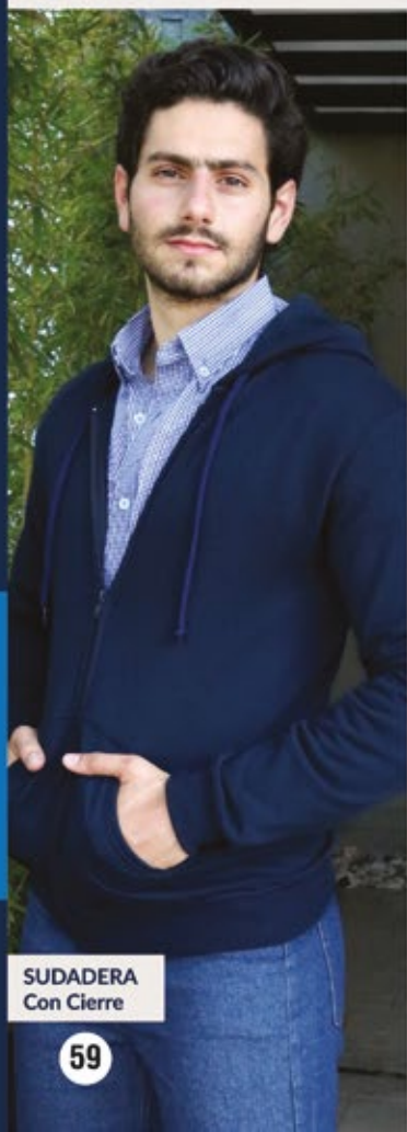
SUDADERA Con Cierre