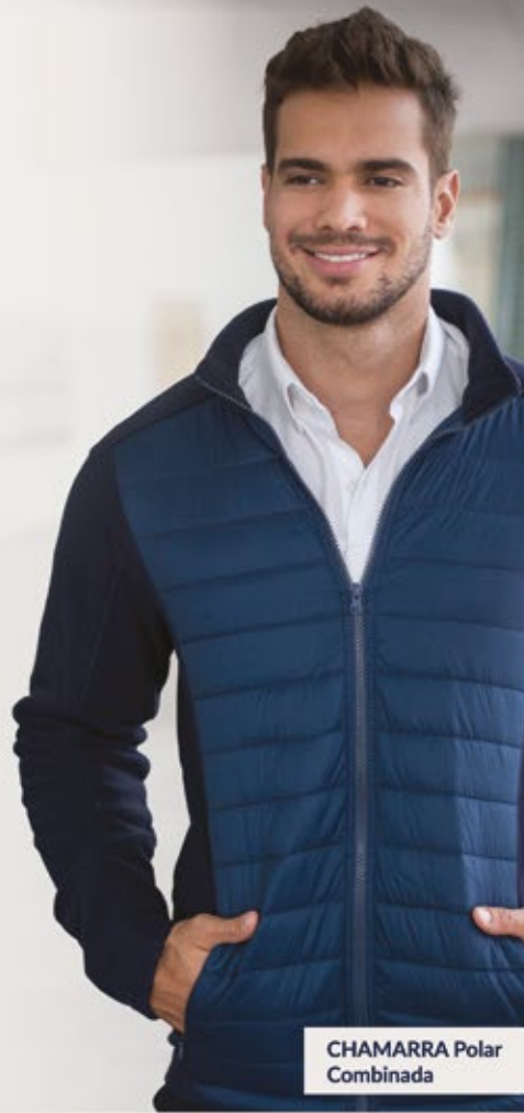
CHAMARRA Polar Combinada