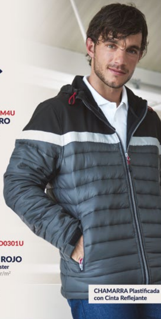
CHAMARRA Plastificada con Cinta Reflejante